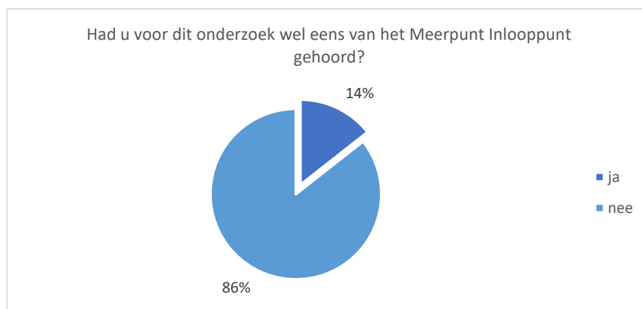
Grafiek 1. Percentage respondenten dat voor het onderzoek wel eens van het Meerpunt Inlooppunt had gehoord (n=896)

Van de respondenten met thuiswonende kinderen (n=337) had 20% voor het onderzoek van het Meerpunt Inlooppunt gehoord. Bij alleenstaande respondenten en respondenten zonder thuiswonende (426 respondenten) is dat gemiddeld 10%.